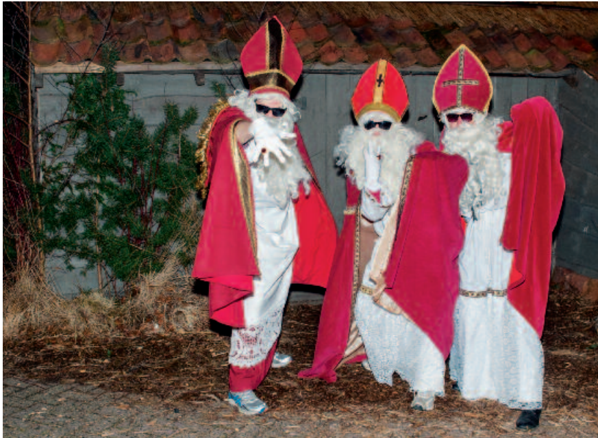
Driekoningenzangers in Retie, 2014

Op veel plaatsen gebeurt het bedelzingen niet langer spontaan. Het wordt georganiseerd door plaatselijke scholen, verenigingen of besturen. Het is vaak een grote uitdaging om voldoende vrijwilligers te vinden die het evenement in goede banen willen leiden. Hoe betrek je jonge mensen, nieuwkomers of inwijkelingen bij de organisatie van het bedelzingen? Hoe zorg je ervoor dat praktische informatie, technieken, kennis en ideeën worden overgedragen aan volgende generaties? Welke samenwerkingen zorgen voor een duurzame toekomst? Veel comités zoeken actief naar manieren om die overdracht makkelijker te maken. Ze stellen draaiboeken op, bouwen duurzame netwerken uit met andere organisaties of werken aan een veiligheidsbeleid.