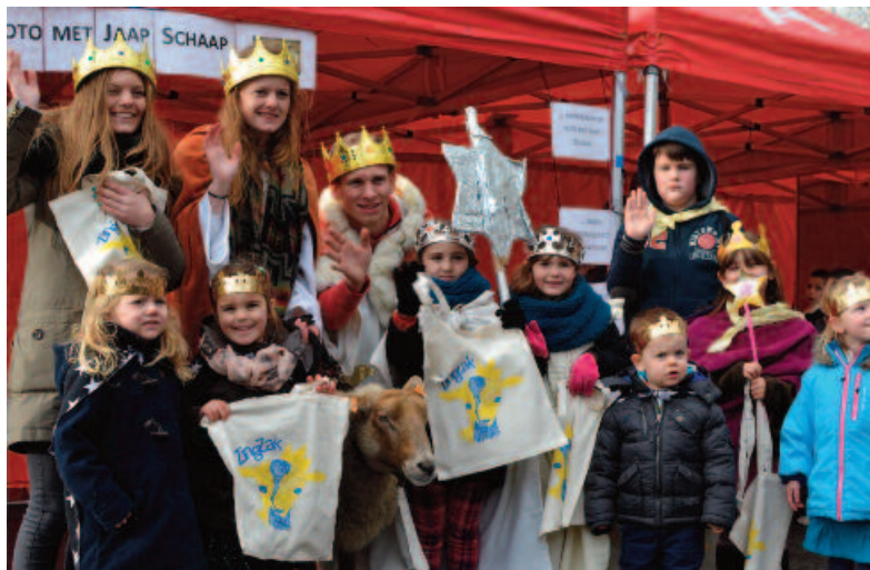
Met zijn tekening van een blauwgele geit won een leerling van de lokale kunstacademie de ontwerpwedstrijd voor een nieuwe zingzak.

Driekoningenzingen was vroeger een populair winterfeest in Wilrijk. De laatste jaren verdwenen de zangertjes echter uit het straatbeeld en bleef het stil op 6 januari. Deze tendens ontging de schepen van jeugd niet. Samen met de jeugddienst bedacht hij een plan om de traditie nieuw leven in te blazen. Het plan werd opgehangen aan een belangrijk attribuut van bedelzangers: de zingzak. Dat is een stoffen zak waarin kinderen geld en snoepgoed verzamelen. De jeugddienst organiseerde een designwedstrijd voor een nieuw model van de zingzak. Daarvoor werkte ze samen met de Academie voor Beeldende Kunsten. Van het winnende ontwerp werden 1500 exemplaren gemaakt. Die werden uitgedeeld aan de Wilrijkse jeugd. De actie rond de zingzak was een goede methode om de aandacht van de kinderen te trekken. Zo raakten ze op een speelse manier vertrouwd met het driekoningenzingen. Ook werd er een docent van de muziekacademie ingeschakeld om kinderen driekoningenliederen aan te leren. De apotheose van het project was het driekoningenfeest op 3 januari 2014. De jeugddienst werkte een wedstrijd uit voor de bedelzangers. Die moesten tijdens hun zangtocht vijf opdrachten vervullen om kans te maken op een prijs. Voor het eerst sinds lang trokken er weer veel kinderen verkleed als koning door de straten, met een zingzak om de hals.