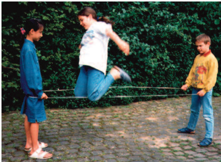
In de Verenigde Staten loopt een project waarbij kinderen zelf hun speelplaatsliedjes documenteren.

studiemateriaal voor iedereen die een publieksproject rond bedelzangliedjes wil opzetten.