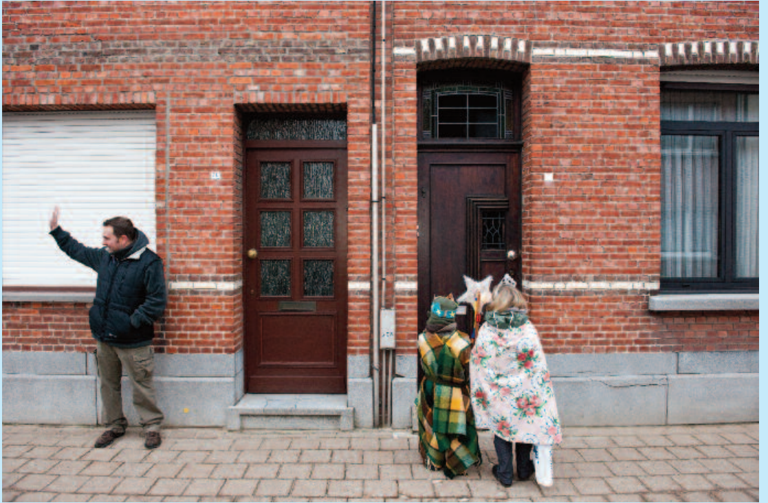
Driekoningenzingen in Wijnegem, 2009.