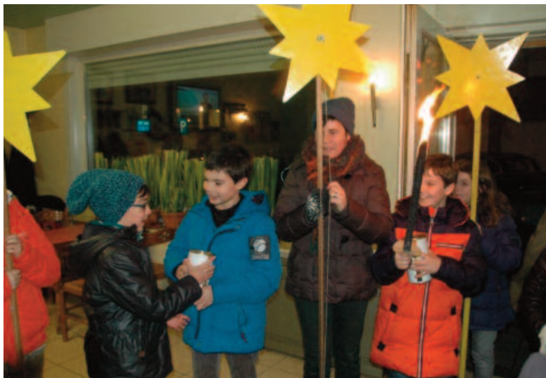
De Gezinsbond van Sint-Joris-ten-Distel herlanceerde het driekoningenzingen.

In het West-Vlaamse Sint-Joris-ten-Distel nemen jaarlijks zo'n honderd mensen deel aan de driekoningstoet. Onder leiding van de plaatselijke fanfare zingen ze op de vooravond van 6 januari allerlei driekoningenliederen. Langs het parcours staan honderden theelichtjes, die de inwoners van het dorp voor de deur plaatsen. Een week op voorhand steken de organisatoren van de stoet bij iedereen een kaarsje in de bus, samen met een begeleidende brief. Zo maken ze hun actie bekend bij het grote publiek. Met succes. Driekoningen doet het kleine dorp letterlijk en figuurlijk oplichten. Toch was het bedelzingen er lange tijd zo goed als verdwenen. De opleving kwam er dankzij de plaatselijke Gezinsbond. Die lanceerde tien jaar geleden de eerste driekoningstoet. Van bij de start stond de stoet in het teken van liefdadigheid. Het goede doel werd in de onmiddellijke omgeving gezocht: de werkgroep vluchtelingen van groot-Beernem. Dat bracht een praktisch voordeel met zich mee. De vrijwilligers van de vluchtelingenwerkgroep zetten zich ook in voor de organisatie van de driekoningentocht. Intussen werkt de Gezinsbond ook samen met de plaatselijke school, de harmonie, lokale handelaars en de vereniging 13+. Wat begon als een kleinschalig initiatief, groeide uit tot een evenement waar de hele gemeenschap bij betrokken wordt. En de bedelliedjes? Die zijn intussen goed gekend bij de plaatselijke jeugd.