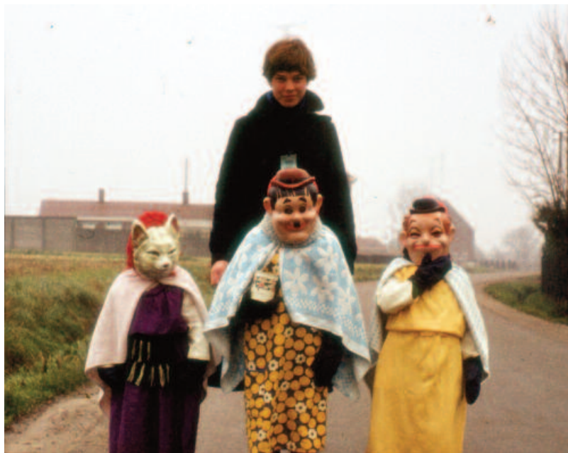
Sterzingen in Welden, 1977.

instrument, net als het organiseren van een publiek feest aan het einde van de dag.