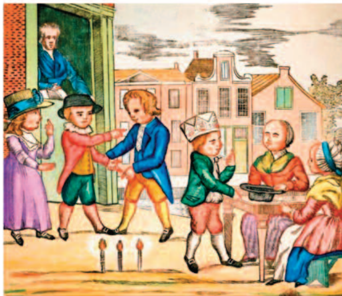
Een beeld uit de Nederlandse lesbrief over Driekoningen.