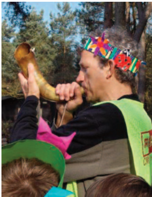
Meester Geert blaast vol trots op een van de laatste authentieke Goriënhoorns.

samenwerking met het gemeentebestuur en Erfgoedcel k.ERF. Anderzijds kochten zij ook een reeks nieuwe hoorns aan. Die blijven in het bezit van de school, zodat versnippering en verlies tegengegaan worden en ten slotte brachten zij een korte infobrochure uit. Hiermee informeerden zij de lokale gemeenschap (en vooral de nieuwe bewoners) over dit bijzondere gebruik.