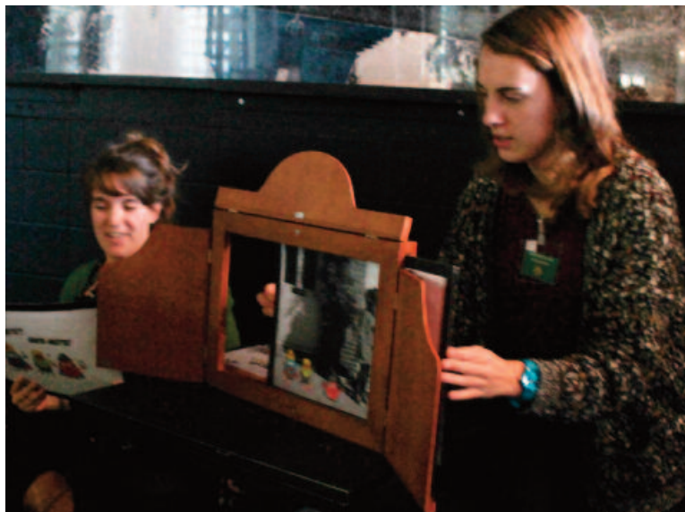
In Mechelen leren kinderen aan de hand van een kamishibai over Sint-Maarten.