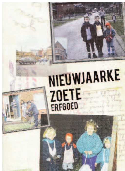
De liedjes van het nieuwjaarszingen in Vorselaar werden gebundeld in deze publicatie.

In 2013 werkten de kindergemeenteraad, de cultuurraad en het gemeentebestuur van Vorselaar samen aan een project rond nieuwjaarszingen. Ook de scholen stapten mee in het project. De kinderen verzamelden nieuwjaarsliedjes, tekenden nieuwjaarskaarten en ontwierpen een nieuwjaarszak om geld en snoep in te verzamelen. De zak werd uitgedeeld aan alle kinderen van het dorp. Het project resulteerde in de publicatie Nieuwjaarke Zoete en een gelijknamige tentoonstelling. Die haalde op de Kunstendag voor Kinderen en de Nacht van het Kempens Erfgoed heel wat kijklustigen. Het project zorgde voor een opmerkelijke stijging van bedelzangers op oudejaarsdag. Aan het gemeentehuis stond een camera opgesteld. Kinderen die er hun nieuwjaarsliedje kwamen zingen, werden gefilmd. De opnames waren vooral bedoeld als publieksactie. Tegelijkertijd zijn de opnames een manier om te documenteren welke liedjes er gezongen worden in Vorselaar. De gemeente wil de actie ieder jaar herhalen om zo de evoluties door de jaren heen te illustreren. Het project Nieuwjaarke Zoete kon rekenen op de steun van erfgoedcel Kempens Karakter.