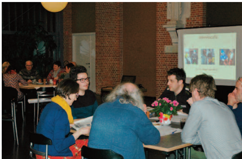
De Erfgoedcel k.ERF organiseerde een ideeëncafé rond bedelzang in maart 2014. Hier zaten de lokale erfgoeddragers, liefhebbers en geïnteresseerden samen om te spreken over de toekomst van dit bijzondere erfgoed.

toekomst. In wat volgt geven we per type van erfgoedzorg een aantal inspirerende voorbeelden.