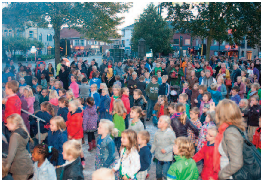
Het Krik Krakcomité zorgt voor een namiddag vol spektakel voor jong en oud.

het Krik Krakcomité gemaakt. Dankzij hun inzet heeft deze traditie opnieuw een vaste waarde in de gemeente.