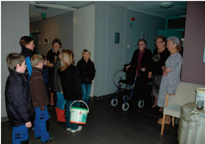
Ook de kinderen van Retie trekken op Sint-Maarten naar het lokale woon- en zorgcentrum om te zingen voor de bewoners.

Tijdens het laatste weekend van september trekt in Dessel een speciale stoet uit. De deelnemers dragen zelfgemaakte lampionnen en zingen 'Kjeske in Lantaern'. De lokale Gezinsbond organiseert sinds kort deze jaarlijkse optocht. Om de traditie een extra dimensie te geven, passeert de stoet langs het plaatselijke woon- en zorgcentrum. Daar zingen de kinderen op de benedenverdieping in groep voor de bewoners. Enkele kinderen mogen ook naar boven gaan. Zij zingen in de kamers van de bewoners die niet meer goed te been zijn. Dit kleinschalige initiatief brengt telkens heel wat positieve reacties met zich mee. Voor de bejaarde inwoners is deze korte zangstonde een nostalgische reis naar hun kindertijd. Ook de zangertjes hebben baat bij het bezoek aan het rusthuis. De meerderheid van de kinderen is niet meer bekend met het Desselse dialect. Doordat de bewoners van het woonzorgcentrum vaak meezingen, komen de kinderen in contact met oudere zangversies en plaatselijke varianten.