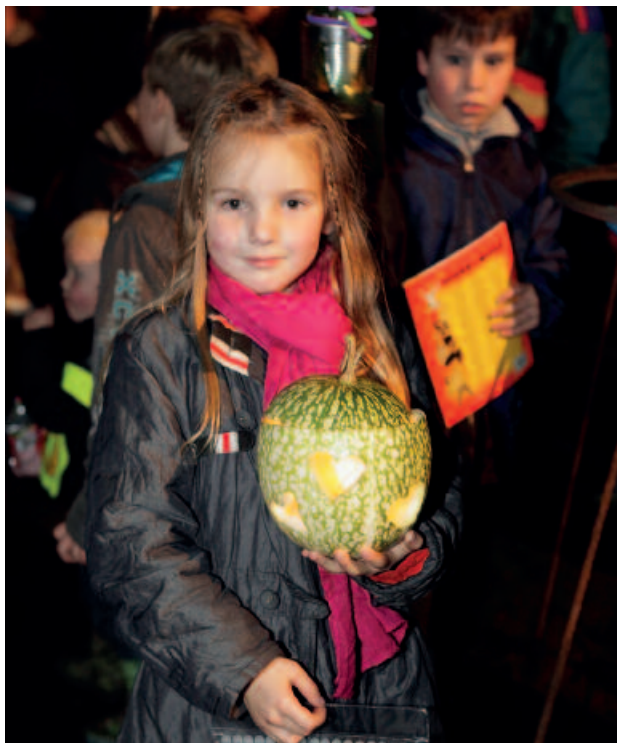
Sint-Maarten in Lommel-Kolonie, 2009.

Je kan mensen op allerlei manieren iets leren over je erfgoed, in de hoop dat ze er wat in zien en de traditie zullen voortzetten. Denk maar aan educatieve pakketten, workshops of demonstraties tijdens evenementen. De meest voor de hand liggende doelgroep is kinderen uit de basisschool. Volgens een ongeschreven wet ligt de leeftijdsgrens voor bedelzangers meestal op twaalf jaar. Het is zinvol leerkrachten van de lagere school hulpmiddelen te geven om het in de les over bedelzingen te hebben. Wat zijn de gebruiken in de streek? Waar komen ze vandaan?