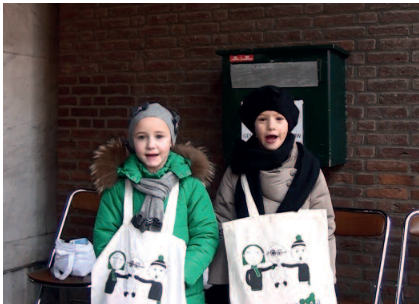
In Vorselaar worden nieuwjaarszingers jaarlijks gefilmd, 2014.

Documenteren betekent dat je de gebruiken van vandaag zo goed mogelijk beschrijft en/of audiovisueel vastlegt. Dergelijk materiaal verzamelen en op een duurzame manier bijhouden is niet eenvoudig. In het verleden werden al heel wat initiatieven ondernomen om volksliederen te inventariseren en op te nemen, zonder plan voor de toekomst. Veel opnamen gingen daarbij verloren om technische redenen. Sommige werden minder interessant doordat er te weinig informatie over de opnamen bewaard bleef. Wie maakte de opname? Wie was de informant? In welke regio werd het liedje gezongen? In welke context werd het lied gebruikt? Om jullie alvast een beetje op weg te helpen stelde Resonant, het expertisecentrum voor muzikaal erfgoed, een korte handleiding op. Die vind je achteraan in deze brochure.