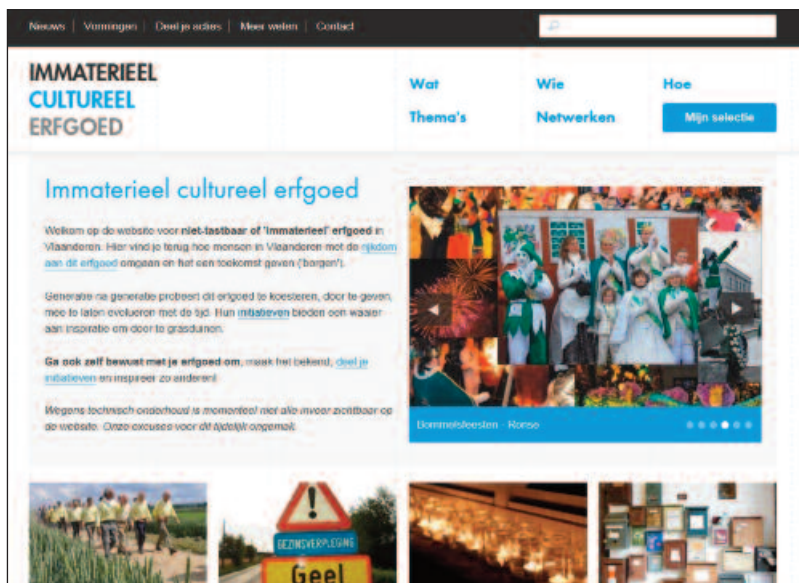
In 2012 werd www.immaterieelerfgoed.be gelanceerd.

De Vlaamse overheid hecht veel belang aan immaterieel erfgoed. Daarom riep ze een aantal hulpmiddelen in het leven. In 2012 lanceerde ze de website www.immaterieelerfgoed.be . Daarop vind je tal van voorbeelden van hoe andere groepen inzetten op erfgoedzorg. Benieuwd hoe het Sinte-Mettelied in Mechelse scholen wordt aangeleerd? Of hoe kinderen uit Sint-Lievens-Houtem al zingend de geschiedenis van de jaarmarkt leren kennen? Grasduin dan even op de website. Je kan ook zelf informatie toevoegen. Je kan er bijvoorbeeld beschrijven welke acties jullie als groep ondernemen om het bedelzingen voort te zetten. Zo inspireer je misschien anderen met een soortgelijke vraag. Sommige mensen willen graag dat hun erfgoed wordt toegevoegd aan de Inventaris Vlaanderen voor Immaterieel Cultureel Erfgoed. Die bestaat sinds 2008 en erkent gebruiken die op een doordachte manier worden doorgegeven. Om erkend te worden als immaterieel erfgoed is het verplicht om samen te werken met een erkende cultureel-erfgoedorganisatie zoals LECA.