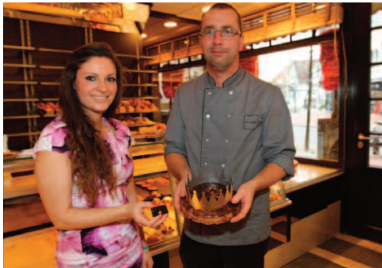
Deze vrouw vond in 2013 een diamanten ooring in de driekoningentaart van bakker DeMaré.

Rond 6 januari verschijnen ze steevast in bakkersetalages: de frangipanetaarten met bijgeleverde papieren kroon. In de taarten zit een voorwerp verstopt. Dat kan een tuinboon, muntstuk of porseleinen beeldje zijn. Meestal stelt het beeldje het kindje Jezus voor, maar soms kiezen bakkers voor een modernere variant. Denk maar aan figuurtjes van Disney, Harry Potter of de smurfen. De verstopte voorwerpen worden ook wel eens fève genoemd, naar het Franse woord voor boon. Wie de boon vindt, mag zich voor een dag uitroepen tot koning of koningin. In bepaalde streken is de taart niet meer zo gekend. Sommige bakkers komen daarom origineel uit de hoek. In Brugge en Knokke bijvoorbeeld werd een gouden ooring in een van de taarten verstopt. De gelukkige winnaar mocht het bijpassende exemplaar afhalen bij een lokale juwelier. De bekende Brusselse bakkerij Debailleuil deed het nog beter. In 2005 verstopten ze 31 edelstenen in hun 2500 taarten, goed voor een totale waarde van 10 000 euro.