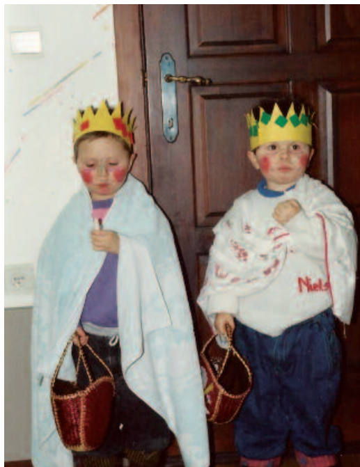
Driekoningenzingen in Mol, 1993.

Niet alle tradities zijn voor de eeuwigheid bestemd. Sommige gaan verloren omdat niemand er nog iets in ziet. Dat is de natuurlijke gang van zaken. Soms smeult een gebruik nog lange tijd na. Veel mensen willen de traditie nog wel beoefenen, maar komen daar om allerlei redenen niet meer aan toe. In zo'n geval kan een traditie opnieuw gelanceerd worden. Veel bedelzangtradities zijn zo ooit nieuw leven ingeblazen. Mensen blijven de gebruiken vaak genegen en ook de liederen zijn doorgaans nog gekend. Wanneer er in zo'n gemeenschap een organisatie opstaat die het bedelzingen wil herlanceren, krijgt die vaak meteen gehoor. Herlanceren kan ook over aspecten van een traditie gaan, zoals het bespelen van een bepaald instrument, het bakken van een specifieke taart of het uitvoeren van een ritueel. Wanneer een gebruik echt 'uitgestorven' is, heeft herlanceren geen zin. De kunst bestaat erin de gebruiken van vroeger te laten aansluiten bij de behoeften van vandaag.