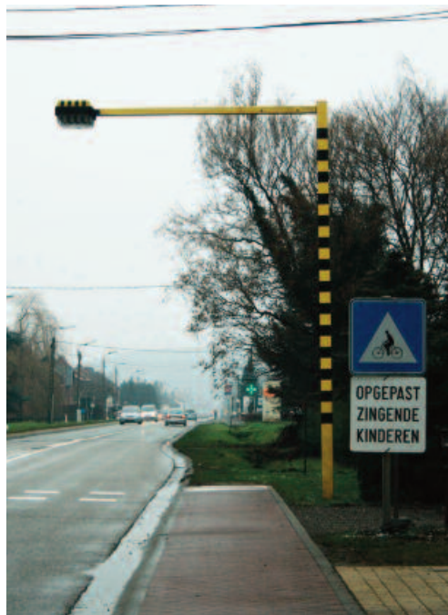
Een tijdelijk verkeersbord in Leuven, 2009.

Steeds meer ouders zijn bezorgd om het drukke verkeer. Ze vinden het niet veilig om hun kinderen alleen de baan op te sturen. Die bezorgdheid kan een bedreiging vormen voor de toekomst van het bedelzangerfgoed. In sommige gemeenten wordt daarom actief gewerkt rond verkeersveiligheid. In Geel worden over de hele stad borden verspreid met daarop 'opgepast zingende kinderen'. Bestuurders worden op deze manier gewaarschuwd, zodat ze hun snelheid kunnen aanpassen. In Meerhout worden de centrumstraten afgezet en volledig verkeersvrij gemaakt. Een politiepatrouille houdt een oogje in het zeil en zorgt voor een veilige oversteekplaats op de hoofdbaan. Die loopt namelijk dwars door het centrum van Meerhout. Ook ouders kunnen het bedelzingen veiliger maken. Sommigen lopen mee langs het parcours. Anderen zorgen ervoor dat de kledij van hun kinderen goed opvalt. Ze verwerken bijvoorbeeld fluorescerende stoffen in de verkleedkledij. Als organisatie kan je dit idee ook groter aanpakken. Organiseer bijvoorbeeld een wedstrijd voor 'de veiligste zang-kledij'. Op die manier verzamel je alle zangers op een centrale plaats en vestig je de aandacht op het veiligheidsprobleem.