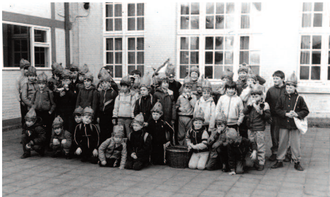
De Schoonbroekse jongens poseren nog even voor een foto vooraleer ze vertrekken op hun Goriën bedelzangtocht (ca.1980).